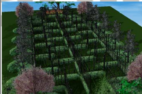
Peiku Health Walker