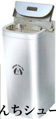
うんちシューター