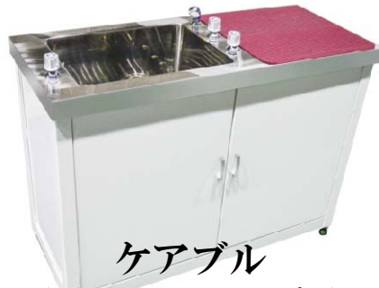
ケアブル (足洗い&シャンプー)